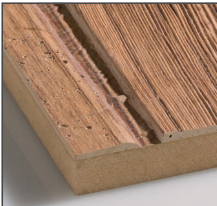
Altholz-Struktur mit einer Dicke von bis zu 6 mm.